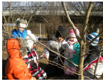
Rådslag i skattletargänget.