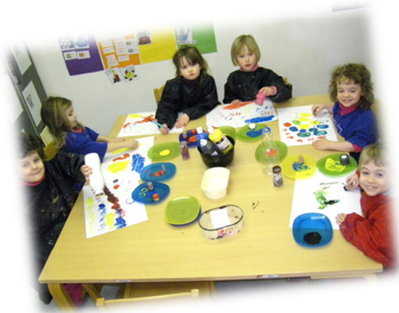
Exploration libre avec pots et bouchons

Après une phase de libre création, les enfants ont été amenés à travailler sur la limitation de leur gestuelle : la consigne était de remplir de traces et d'empreintes une zone délimitée par un cadre noir, en essayant de ne pas dépasser.