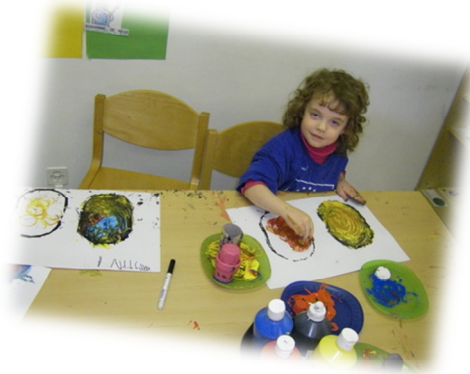
Traces et empreintes dans un espace limité

Enfin, vendredi en fin de journée, les enfants se sont régalés à peindre librement au pinceau et au doigt, sur chevalet !